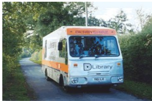
Aklatang Umiikot sa Iba't ibang Lugar

This free service is available for people of all ages who are unable to access our libraries either on a temporary or permanent basis. We deliver to people in their own homes, or in care homes or sheltered accommodation.